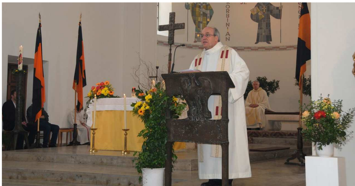
Verabschiedungsgottesdienst der KF St. Benedikt am 1. Mai 2011