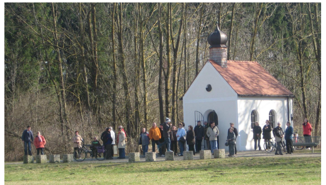
Rast an der Kolomannskapelle in der Isarau

Bei herrlichem Sonnenschein machte sich dann die Wandergruppe von rund 45 Personen auf den Weg durch Ismaning, entlang der Isarau zur Kolomannskapelle, wo eine kurze Andacht stattfand. Weiter führte der Weg in Richtung Unterföhring. Letzte Rast war der Kolpingraum im Pfarrzentrum in Unterföhring, wo die Kolpingsfamilie Unterföhring die Wanderer zu Kaffee und Kuchen einlud.